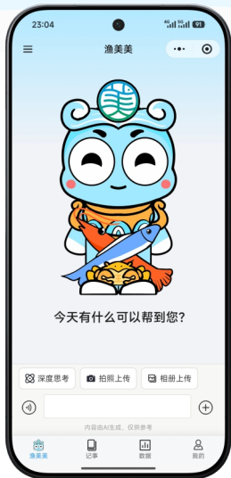
高度定制的专属大模型智能体