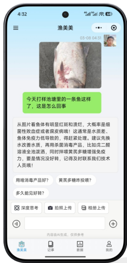
专家级水产大模型